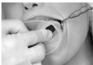
Фото 4: интраоральное кольцо позиционировано в преддверии полости рта.