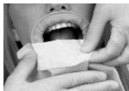
Фото 6: извлечение OptraGate ExtraSoft