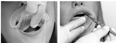
Фото 5: Окончательное расположение за верхней и нижней губой.

Если в отдельных случаях при полном закрытии рта интраоральное кольцо начинает выскальзывать из области нижней губы, чаще всего достаточно просто поместить глубже интраоральное кольцо. В любом случае, можно воспользоваться соответственно другим размером.