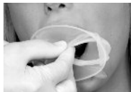
Фото 3: более толстое интраоральное кольцо задвигается между зубным рядом и углом рта.