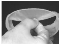
Фото 2: правильное удерживание интраорального кольца между большим и средним пальцем. Интраоральное кольцо при этом слегка сжимается.