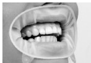
Фото 1: Надетый OptraGate ExtraSoft с крыльшками, направленными вниз. Оклюзия не нарушена.

Эластичный материал OptraGate ExtraSoft натягивается между двумя кольцами. Более толстое кольцо надевается при работе с пациентом интраорально в области переходной складки, в то время, как более тонкое кольцо с двумя крыльшками находится вне ротовой полости. Натянутая между кольцами эластичная часть может удерживать губы пациента и вытесняет кольца благодаря усилию, создающемуся в резине (см. фото 1).